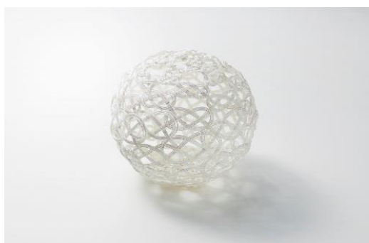
クリスマスツリーの演出に使用する水引（イメージ）