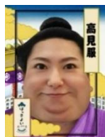
「すもう撮りカメラ」イメージ