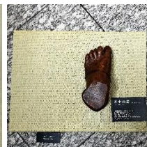
「力士の手型、足型」イメージ