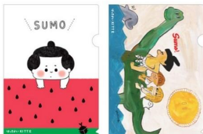
オリジナルグッズイメージ

物販コーナーでは、かわいらしいイラストを使用したコースターやポチ袋、トートバッグ、ポーチ、サコッシュなど本イベントオリジナルの様々なグッズを販売します。