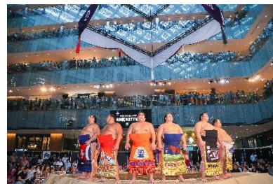
「大相撲KITTE場所」昨年の様子