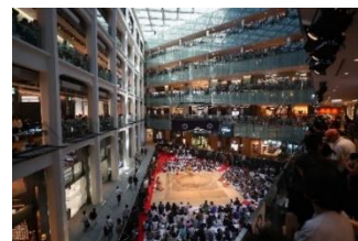
昨年の「大相撲KITTE場所」