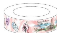
オリジナルマスキングテープ イメージ

KITTE館内にて配布・設置される本イベントのリーフレットを対象店舗でご提示いただくと、お会計10%OFFやワンドリンクサービスなどのお得な特典を受けられます。さらに、お会計額が2,000円（税込）以上の方には、KITTE限定のTakarazuka Revue GOODS SHOWオリジナルマスキングテープを一つプレゼントします。