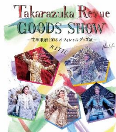
「Takarazuka Revue GOODS SHOW ～宝塚歌劇を彩るオフィシャルグッズ展～」 イメージ

「にっぽんらしさと、あたらしさを。」を施設コンセプトとするKITTEで行われる夏イベントに、ぜひご期待ください。（イベント詳細は別紙のとおりです。イベント内容は予告なく変更となる場合があります。）