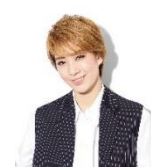
とわき せあさん 永久輝せあさん