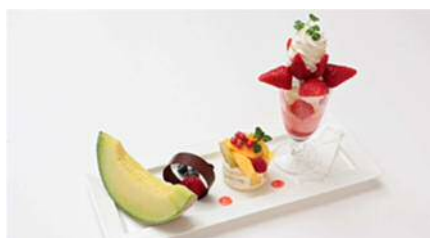
5周年限定グルメの一例