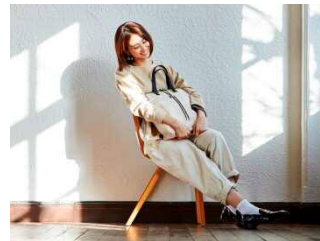
AYANOKOJI X 商品イメージ