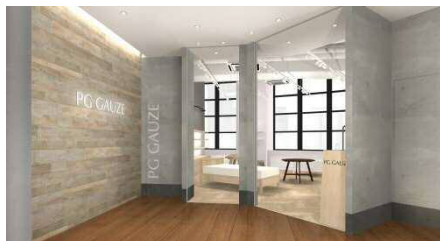
PG GAUZE 店舗イメージ

また、5月以降も順次リニューアルを実施予定です。詳細については、別途お知らせします。