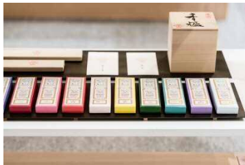
薫玉堂 商品イメージ