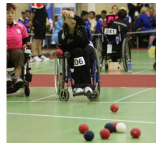
ポッチャ（イメージ）