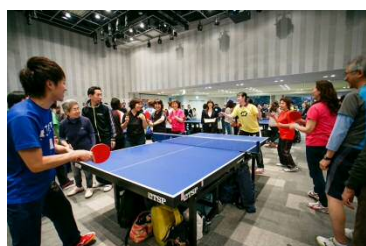
卓球コーナー （イメージ）