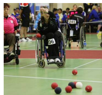
ポッチャ（イメージ）

リオデジャネイロで日本代表チームが目覚ましい活躍をし、現在注目を集めている、子どもから高齢者・障がいの有無に関係なく共通ルールで楽しむことができるポッチャ競技を、実際に体験いただけます。