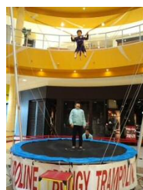
バンジートランポリン （イメージ）