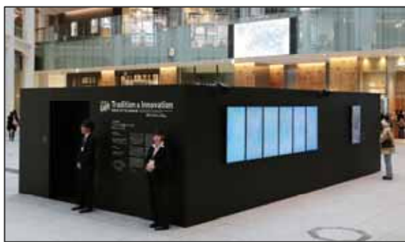
< デジタルアート展の様子 >