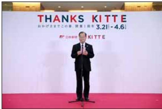
< K I T T E 1 周年セレモニーの様子 >