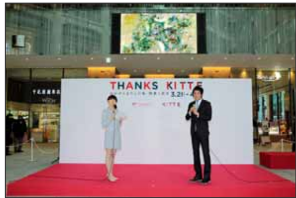
< K I T T E 1 周年セレモニーの様子 >