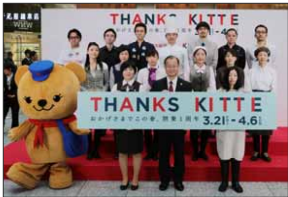
< K I T T E 1 周年セレモニーの様子 >