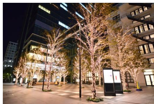
1Fテラス イルミネーション

2F～6Fの休憩スペースには、約1.6mのクリスマスカード型フロアオブジェが設置されるほか、1Fのウィンドウディスプレイがクリスマスデザインに、さらにポスターケースがクリスマス装飾へと変わります。また11月中は、プロジェクターにより雪が投影される演出を行うなど、K I T T E全体が白い世界へと様変わりしていきます。