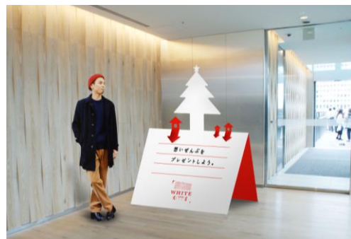
クリスマスカード型フロアオブジェイメージ

12月2日のツリー設置以降、週末を中心にクリスマスソングやスタンダードナンバーなどのライブを予定しています。