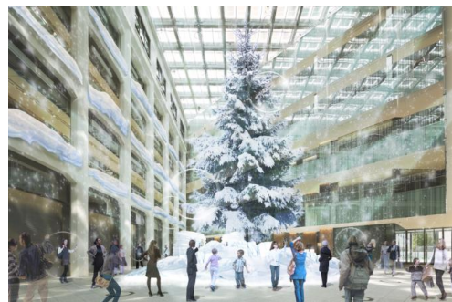
1Fアトリウム クリスマスツリーイメージ

雪化粧によってあたかも屋外で雪が降り積もったかのような、高さ約14.5mの屋内日本最大級のクリスマスツリーが登場します。ミラーボールに光を照射することで、光の粒が天井から壁面を伝って雪が舞い散るように降り注ぎます。