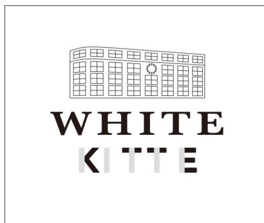
「WHITE KITTE」 キービジュアル