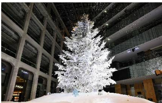
1階アトリウム クリスマスツリー 昨年の様子

（イベント開催概要は別紙1、KITTE各店舗のおすすめ商品情報は別紙2を参照。）