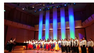
クリスマスコンサート イメージ

音楽による社会貢献を目的とし、都内を中心に活動している社会人混声合唱団の「丸の内合唱団」が、クリスマスコンサートを開催します。聴き馴染みのあるクリスマスソングを中心に披露し、ご来場の皆さまにお楽しみいただきます。観覧無料です。