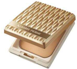
「しっとりツヤ肌 パウダーファンデ」イメージ

株式会社伊勢半が昨年の夏から開催してきたキスミー フェルム「きれい応援プロジェクト 紅筆リキッドルージュ体験イベント」が、今秋さらにパワーアップしました。今回は、新発売の「しっとりツヤ肌 パウダーファンデ」が体験できます。プロのメイクアップアーティストによるメイク体験や、プロのカメラマンによる撮影会を実施。お撮りした写真は、後日、株式会社伊勢半からお送りします。