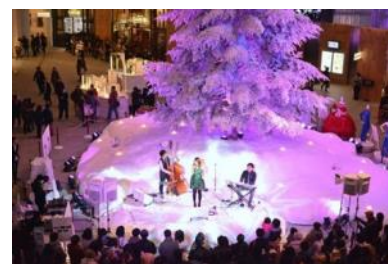
クリスマスライブ (昨年開催時の様子)

クリスマスソングやスタンダードナンバーなどを披露するクリスマスライブをツリーの前で実施します。