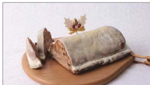
シュトーレン/大 3,888円 小 1,080円

スポンジケーキ、フランボワーズムース、クッキークリームとの3層仕立て。絶妙な甘酸っぱさとかわいらしいピンク色、フランボワーズのやさしい香りに心が弾む一品です。ベリー・ゼリーもアクセントに。※サイズ/4号 販売期間：12/19～12/25 ※11/1～12/18 まで予約可。(お渡しは12/19～12/25)