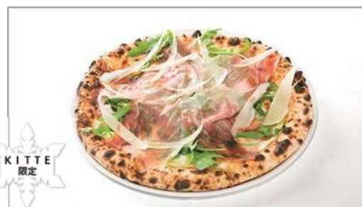
パルマの生ハムとルーコラ、パルミジャーノの ピアンカピッツァ／2,138円

名物フカヒレとパイパイのスープや、特大エビ、国産牛ホホ肉など、料理長厳選の食材をぜいたくに味わえるクリスマスシーズン限定のお得なコース全 8 品。東京駅舎が見える夜景が楽しめる席も有。限りがあるので予約は早めに。販売期間：12/23～12/27 ※ディナー限定、要予約。