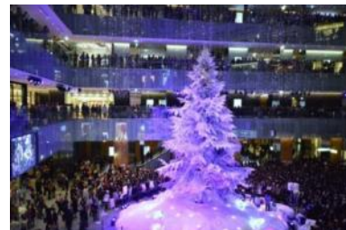
ライトアッププログラム (昨年開催時の様子)

あたかも雪が降り積もったかのように真っ白な、屋内では日本最大級の高さ約 14.5m のクリスマスツリーが 1F アトリウムに登場。期間中は、情緒的な音楽とともに、光の粒が天井から壁面を伝って、雪が舞い散るように降り注ぐライトアッププログラムを上映いたします。