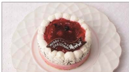
牧場のベリームースケーキ／2,000円

スペイン産バレンシアアーモンドを使用した風味豊かな生地にクランチ入りのミルクチョコをコーティング。ドライフルーツをのせて Xmas リース風に仕上げたかわいいケーキです。※サイズ/直径 11cm x 高さ 5cm 販売期間：12/1～12/25