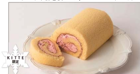
こしひかり米粉を使った苺のロール／1,080円