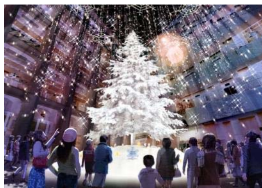
1Fアトリウム クリスマスツリー イメージ