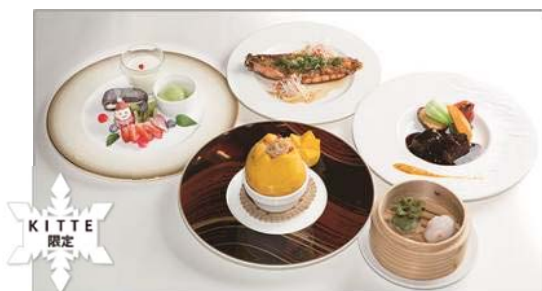
クリスマス限定ディナーコース／10,000円