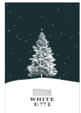
「WHITE Tree Letter」イメージ

<本件に関する報道関係の方のお問い合わせ先> KITTE PR事務局 (平日9:30～18:00) TEL: 03-4376-6910 / FAX: 03-3222-0292