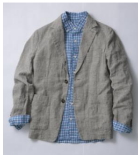
リネンワッシャージャケット/ フレンチリネンチェックB・Dシャツ [nest Robe CONFECT / 3F]