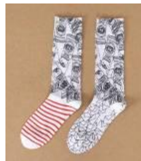
■KITTE1周年限定プリントソックス 各 2,000 円(税抜き)