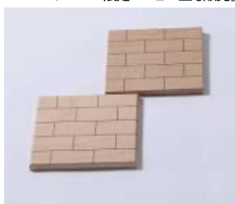
■赤レンガコースター 400 円(税抜き)