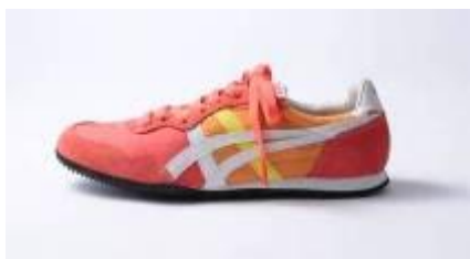
■SERRANO(セラノ) 8,000 円(税抜き)