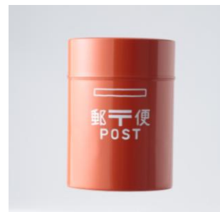
■KITTE限定 プリキポスト缶 朱(大・小) 大: 1,800 円(税抜き) 小: 1,500 円(税抜き)