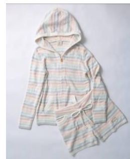
■moco moco 'スムーズイー' カラフルボーダーパーカ&ショートパンツ 9,400 円(税抜き)

※レディースKITTE限定商品(30着)や、IFNi COFFEEのKITTE限定コーヒー豆も販売。