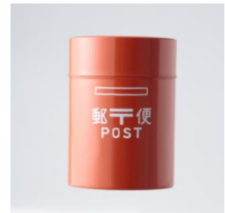
KITTE限定 プリキポスト缶 朱(大・小) [中川政七商店 / 4F]