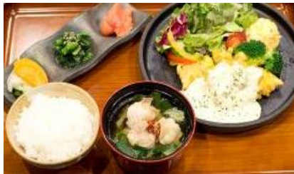
■とりもつえん 名物 もつ鍋仕立ての スープとさつま赤鶏のチキン南蛮定食 1,500円(税抜き)