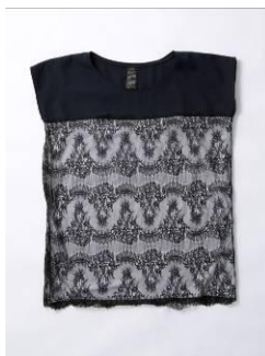
■レースカットソー 14,000 円(税抜き)