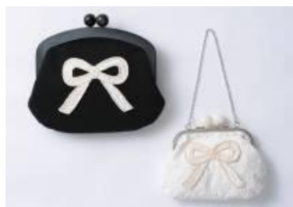
■KITTE 1st Anv がま口クラッチバッグ 左: 16,800 円(税抜き) がま口ポーチ 右: 12,800 円(税抜き)