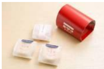
■KITTE限定味噌汁最中(3ヶ入) 800円(税抜き)