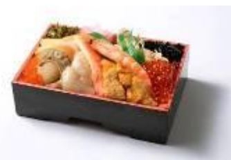
■四季の詩(海鮮のつけ弁当) 1,300円(税抜き)