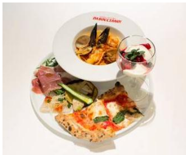
KITTE1周年記念アニバーサリー 「ピアットウニコランチ」