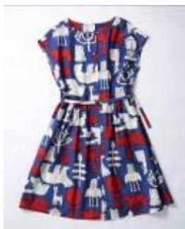
■ツイル forest プリント ひざ丈 ワンピース 15,800 円(税抜き)