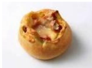
■完熟セミドライトマトとバジルの チーズブレッド 300円(税抜き)