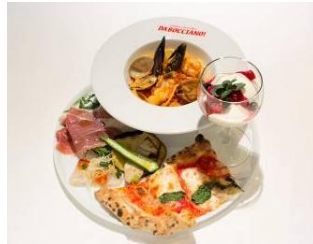
■KITTE1周年記念アニバーサリー 「ピアットウニコランチ」 1,800円(税抜き)