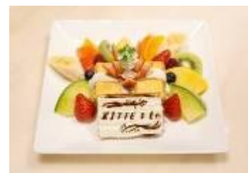
■KITTE アニバーサリープレート 1,600円(税抜き)