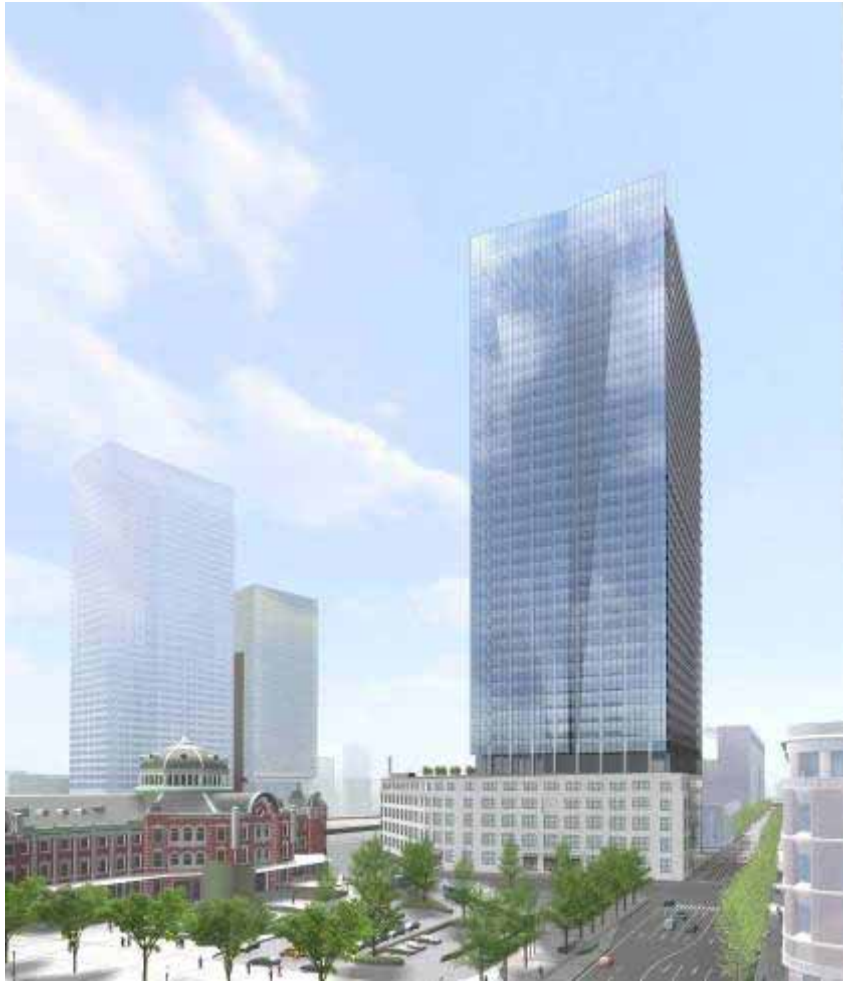
新丸ビル側からの外観イメージ