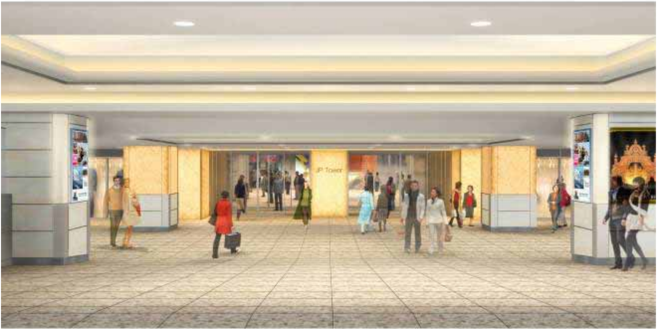
東京駅前地下通路から見た地下1階エントランスイメージ