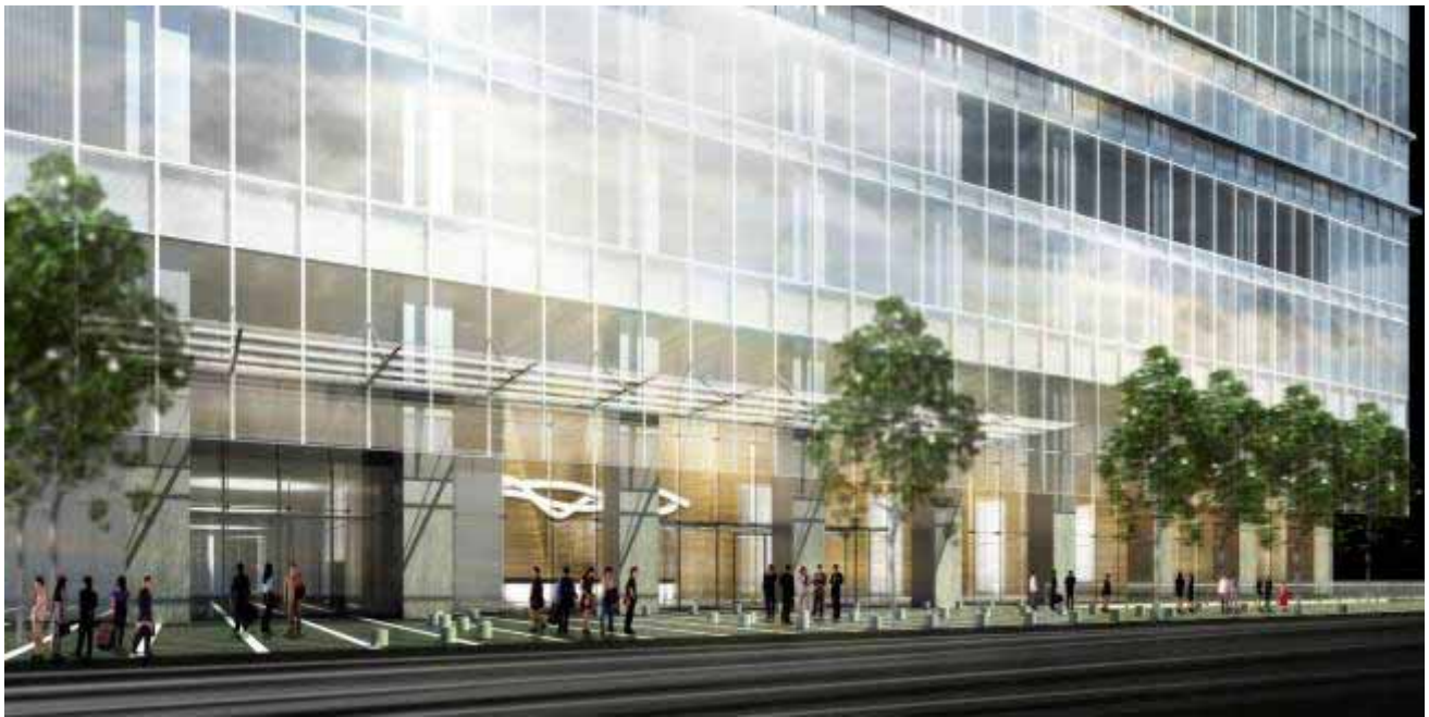
1 階車寄せ及びオフィスエントランスイメージ