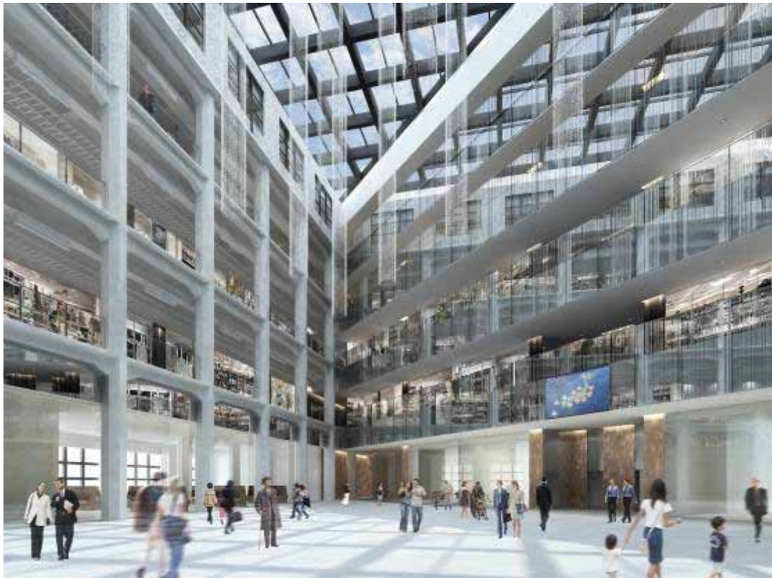
低層部吹抜け部分のイメージ